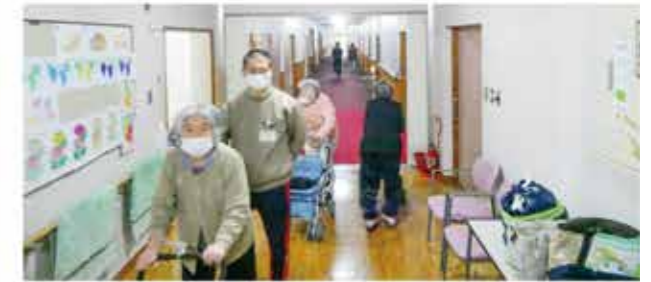
みんなで歩こう! イチ・ニ! イチ・ニ!!