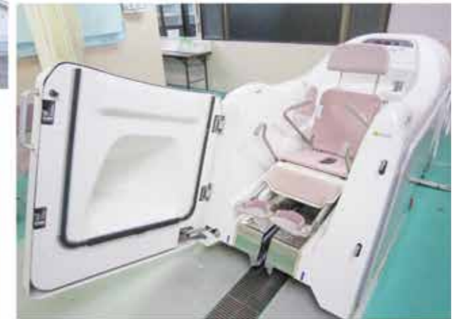
↑これがお風呂です! 好評です♥