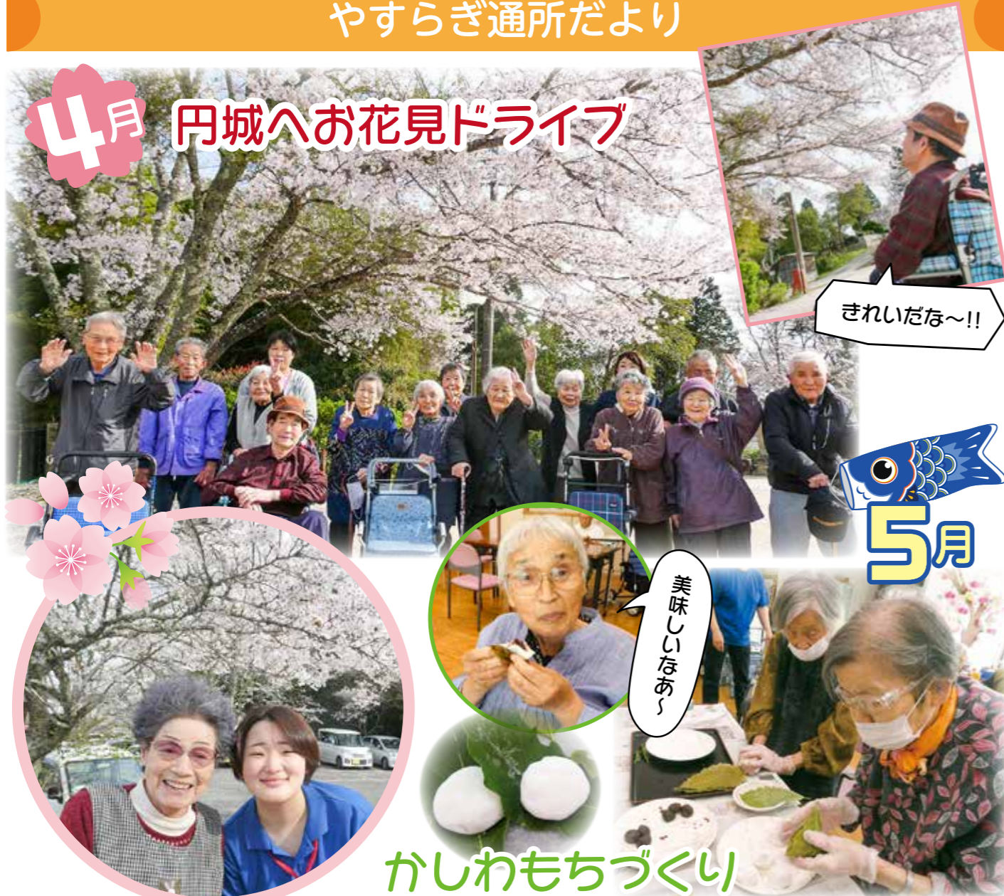
かしわもちづくり