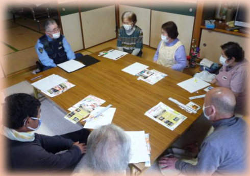
◆いきいきサロン活動

身近な地域において、人と人のつながりや、住民主体の自然な見守りや 支え合い活動を応援しています。