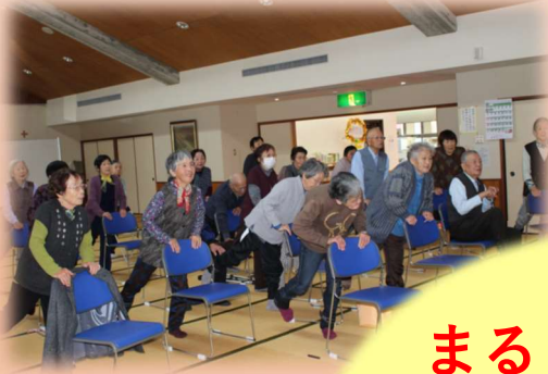
◆はつらつ元気体操