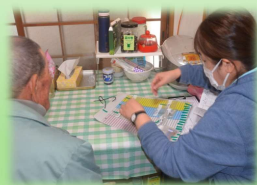
◆ヘルパー(訪問介護)