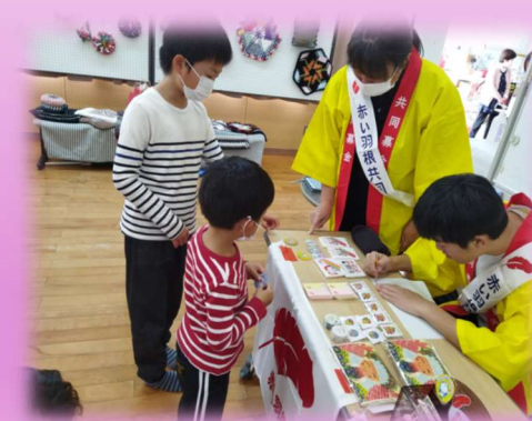
◆赤い羽根共同募金