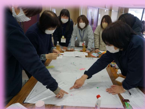
◆災害ボランティアセンター研修

誰もが住みやすいまちにするため、幅広い世代の方がボランティア 活動に興味・関心を持てるように、きっかけづくりや情報提供、講座 の開催をします。