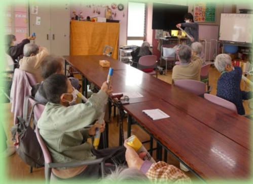
◆やすらぎデイサービス(通所)

自宅で自分らしく日常生活が続けられるように、一人ひとりにあった 適切なサービスの提供からご家族のリフレッシュ支援までお手伝いします。